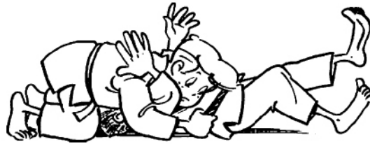
KAMI-SHIHO-GATAME CONTRÔLE ARRIÈRE STERNAL