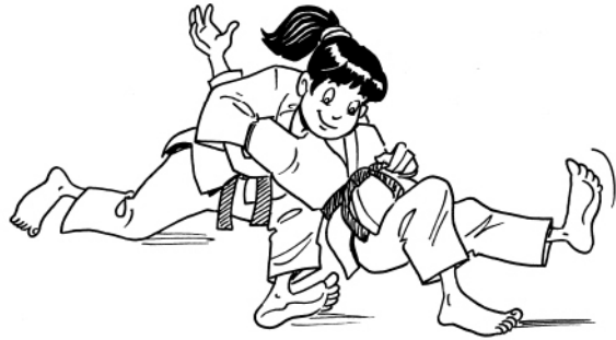
USHIRO-KESA-GATAME CONTRÔLE ARRIÈRE COSTAL