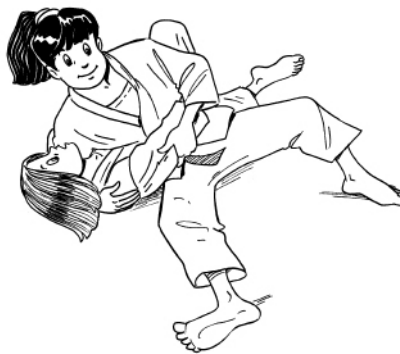
HON-GESA-GATAME CONTRÔLE LATÉRAL-COSTAL